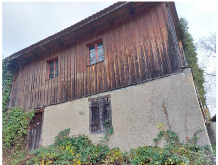
Abb. 1: Süd-west-Fassade, am Weg zur „Unteren Mühle“. Im gemauerten Untergeschoss die gesamte Antriebsmechanik, oben das eigentliche Sägewerk.