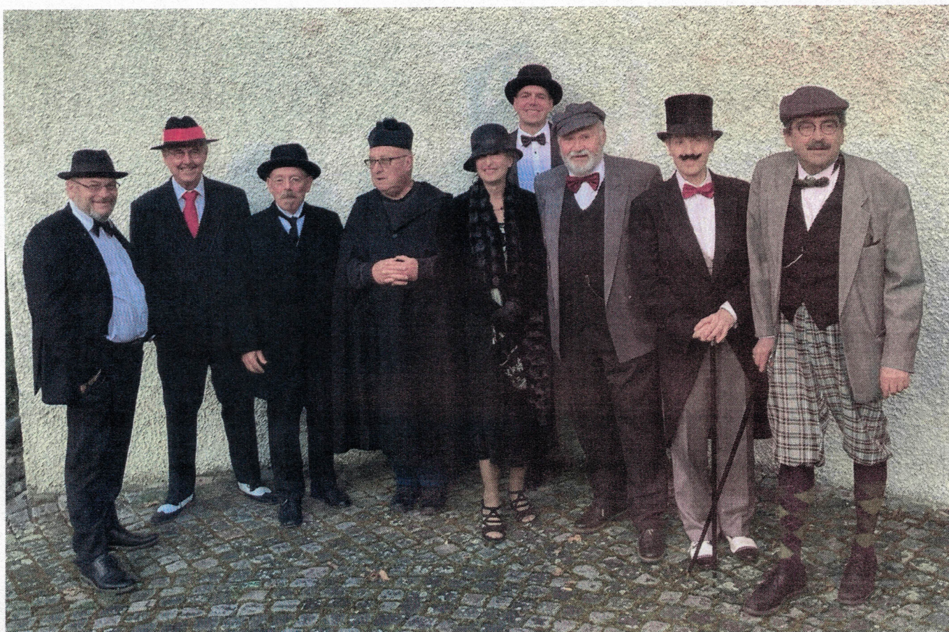
Der Vorstand der Historischen Vereinigung Bezirk Zurzach am 22. März 2025, nach der offiziellen Jahresversammlung.